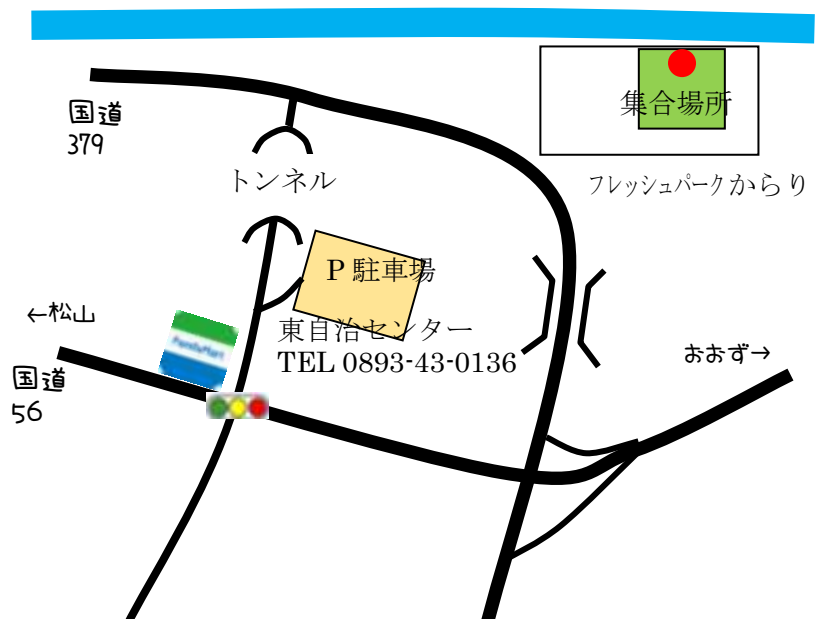
(駐車場・集合場所 MAP)

主催：うちこグリーンツーリズム協会 共催：内子フレッシュパークからり 後援：うちこ手しごとの会